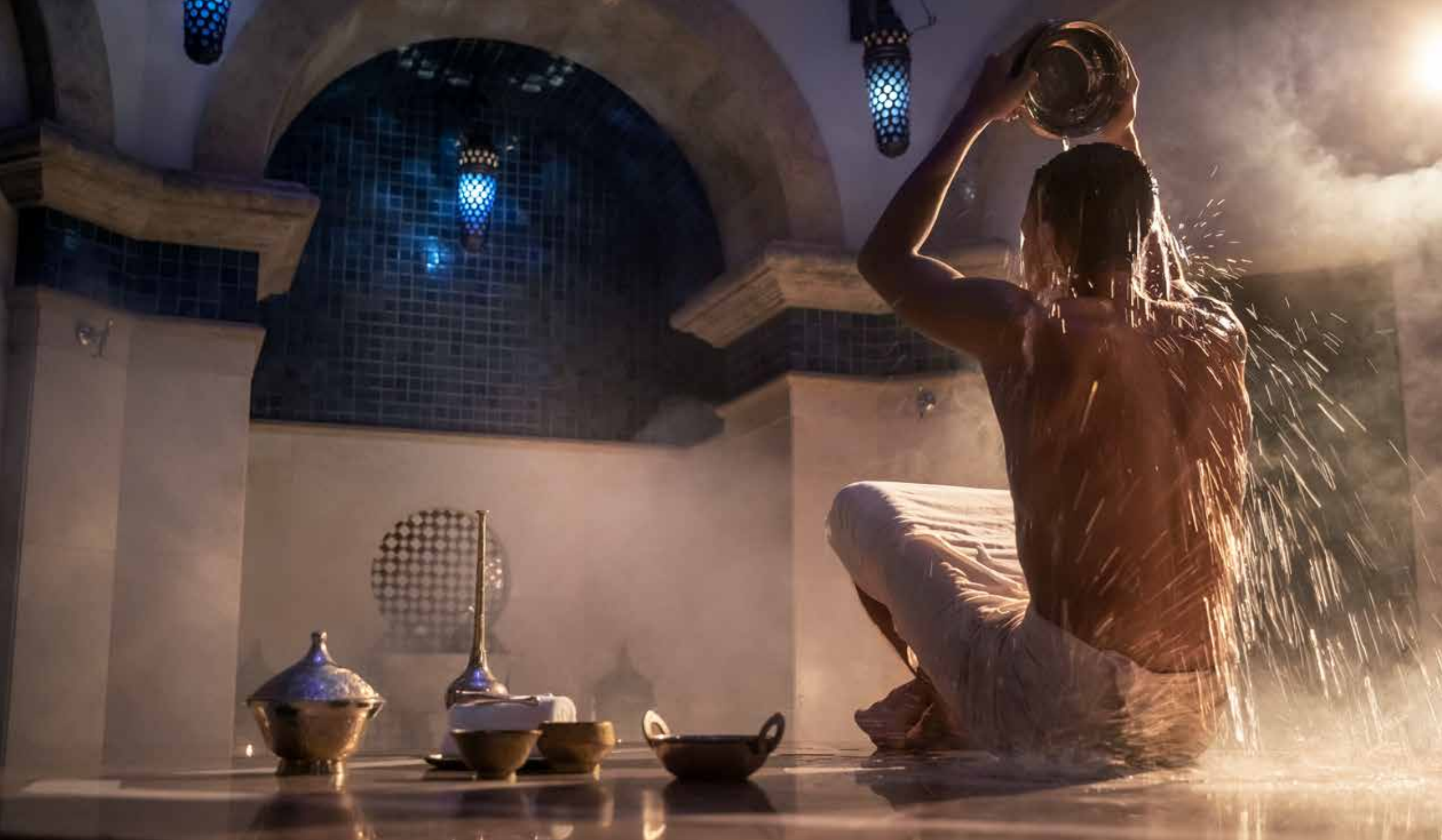
Oriental Hammam, One&Only Royal Mirage, Dubai