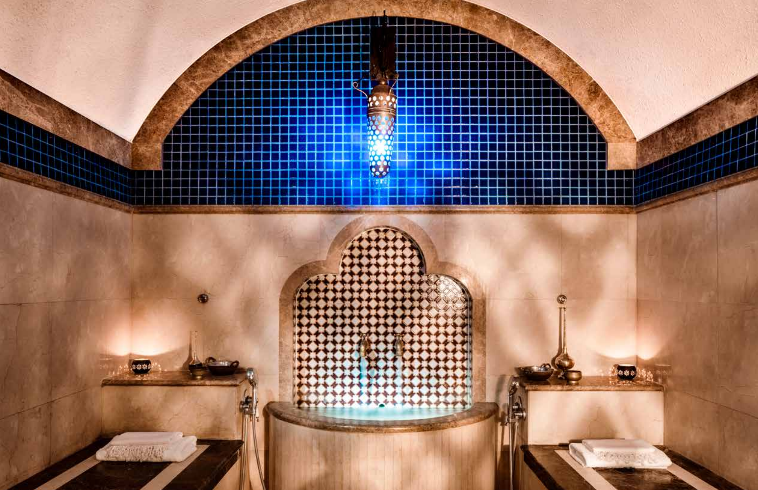
Oriental Hammam, One&Only Royal Mirage, Dubai