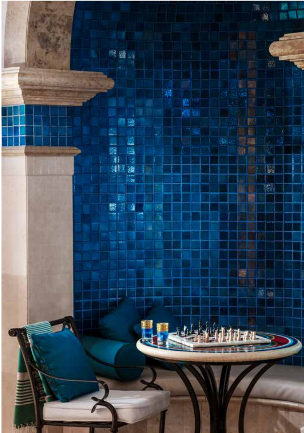
Oriental Hammam, One&Only Royal Mirage, Dubai